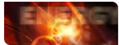
KIT-Zentrum Energie: Zukunft im Blick

Das Eigenheim der Zukunft bietet nicht nur moderne Wohnqualität, sondern auch effiziente Energielösungen, die individuell abgestimmt sind. Von intelligenten Stromzählern bis zu mitdenkenden Wärmewänden – viele Technologien ermöglichen es dem Verbraucher, den persönlichen Energiebedarf zu bestimmen und somit einen Beitrag zur Energiewende zu leisten. Doch wie können diese Technologien ausgebaut und gefördert werden? Sind Smart Homes und Smart Metering, also intelligente Regulierungen des Energieverbrauchs, noch ferne Zukunftsmusik? Und was kann Menschen dazu bewe-