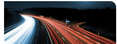
KIT-Zentrum Mobilitätssysteme: Lösungen für die Mobilität von morgen

„Bei der Fahrzeugentwicklung alle Anforderungen miteinander zu vereinbaren, ist ein schwieriger Prozess“, sagt Sascha Ott, Leiter der Forschungsabteilung Antriebssystementwicklung am IPEK und Geschäftsführer des KIT-Zentrums Mobilitätssysteme. „So geht es beispielsweise darum, den Kraftstoffverbrauch und die Schwingungsentwicklung zu optimieren sowie neue Fahrstrategien zu implementieren. Gleichzeitig soll das Fahrzeug lange halten: unter wechselnden Umweltbedingungen und bei unterschiedlichen Fahrstilen.“ Für komplexe Produktentwicklungen bietet das iPeM einen systematischen, ganzheitlichen Ansatz, der unter anderem die