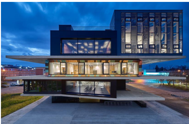
In der Testwohnung finden sich Primärrohstoffe wie unbehandelte Weißtanne genauso wie neu entwickelte Baumaterialien und recycelte Wertstoffe.

Innovative Wohneinheit als Experimentierfeld für nachhaltiges Bauen – Dämmplatten aus Pilz-Myzel und Wandverkleidungen aus Altglas und Getränkekartons