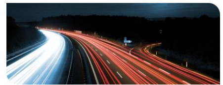
KIT-Zentrum Mobilitätssysteme: Lösungen für die Mobilität von morgen

Wenige Tage vor dem 174. Geburtstag des deutschen Automobilpioniers treffen sich am Donnerstag, 22. November 2018, Vordenker und Gestalter der Mobilität von morgen zur 10. Carl-Benz-Gedenkvorlesung. In drei Vorträgen beziehen sie Stellung zu den großen Herausforderungen, vor denen Mobilitätstechnik und -wirtschaft stehen: dem