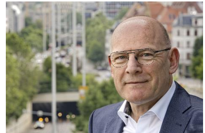
Winfried Hermann

Als „Die Forschungsuniversität in der Helmholtz-Gemeinschaft“ schafft und vermittelt das KIT Wissen für Gesellschaft und Umwelt. Ziel ist es, zu den globalen Herausforderungen