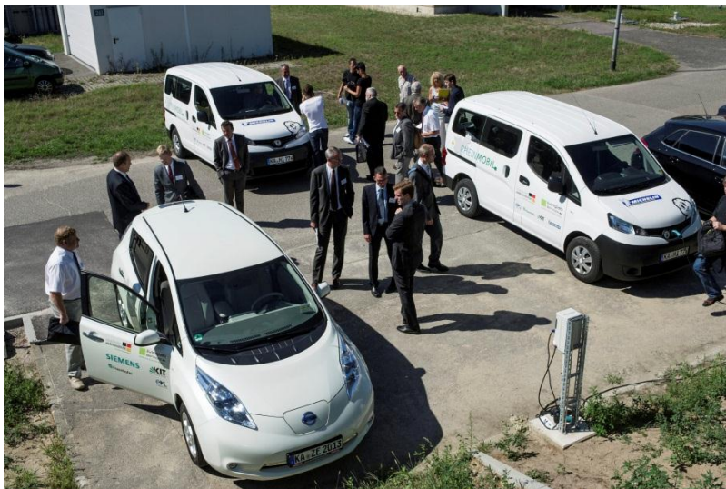
RheinMobil ist seit dem Frühjahr auf der Straße: Daten aus Pendel- und Dienstfahrten liefern die Grundlage für die weitere Entwicklung

Elektromobilität: grenzüberschreitendes Projekt RheinMobil mit Trendmeldungen zu Wirtschaftlichkeit, Betriebserfahrungen und ökologischem Nutzen