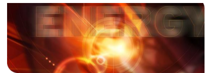
KIT-Zentrum Energie: Zukunft im Blick