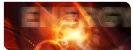
KIT-Zentrum Energie: Zukunft im Blick

Auf dem Weg in die CO 2 -neutrale Gesellschaft unterstützen Power-to-X-Prozesse (P2X), also Verfahren zur Umwandlung von erneuerbarer Energie in chemische Energieträger, bei der Verzahnung unterschiedlicher Sektoren. Aus Wind- oder Sonnenstrom können etwa synthetische Kraftstoffe hergestellt werden, die klimafreundliche Mobilität und Gütertransporte ohne zusätzliche Treibhausgasemissionen