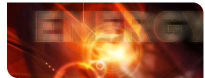
KIT-Zentrum Energie: Zukunft im Blick

Forscher des KIT untersuchen die Rußbildung in Motoren mit Kraftstoffdirekteinspritzung