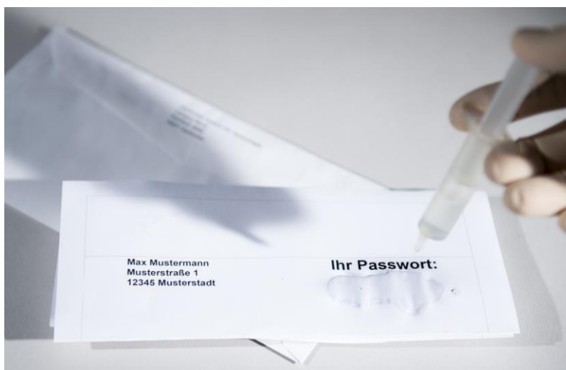
Unsichtbares Passwort: Die Information für die Verschlüsselung steckt im Molekül, zum Beispiel als Flüssigkeit auf Papier aufgetropft.

Wissenschaftler des KIT designen chemische Verbindungen, die als Passwörter für verschlüsselte Informationen eingesetzt werden können – Veröffentlichung in Nature Communications